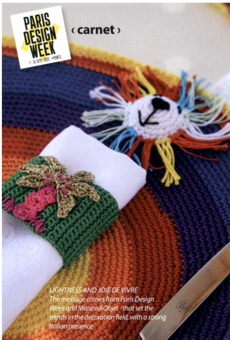
LIGHTNESS AND JOIE DE VIVRE The message comes from Paris Design Week and Maison&Objet - that set the trends in the decoration field, with a strong Italian presence